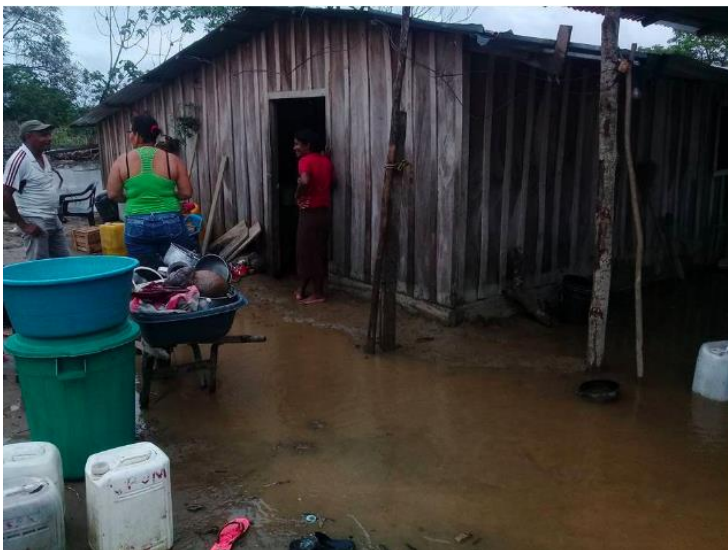
Municipio de Achí, Bolívar, en la subregión de La Mojana

La Unidad de Gestión del Riesgo en el 2017 afirmó que 800 familias, y 70 por ciento de la zonas rurales fueron afectadas en el departamento de Bolívar. Cerca de 10.000 hectáreas de arroz se perdieron debido a inundaciones en La Mojana. Los municipios más afectados fueron: Nechí (Antioquia) con 4.000 hectáreas, San Jacinto del Cauca (Bolívar) 3.000, Ayapel (Córdoba) 1.000 y en Sucre, San Marcos con 1.500 y San Benito, 500.